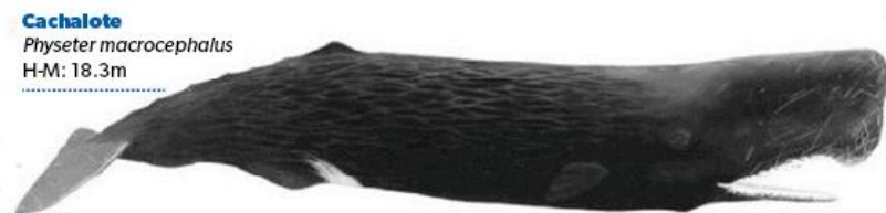
Cachalote Physeter macrocephalus H-M: 18.3m