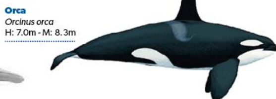
Orca Orcinus orca H: 7.0m - M: 8.3m