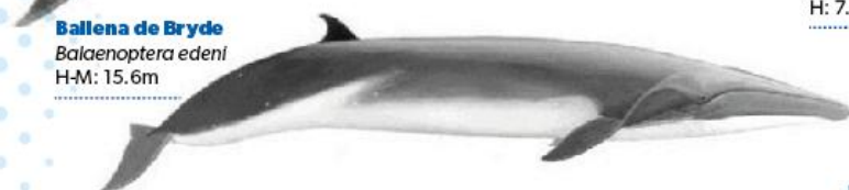
Ballena de Bryde Balaenoptera edeni H-M: 15.6m