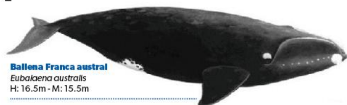
Ballena Franca austral Eubalaena australis H: 16.5m - M: 15.5m