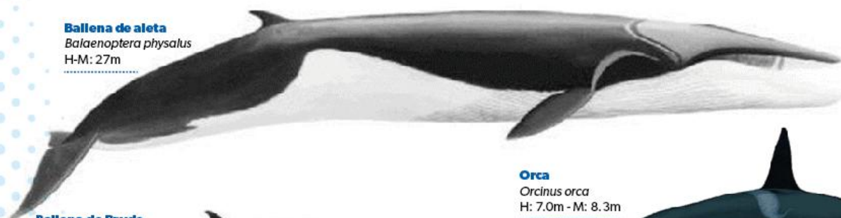
Ballena de aleta Balaenoptera physalus H-M: 27m