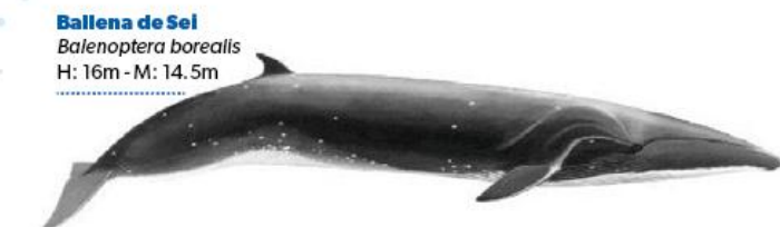
Ballena de Sei Balaenoptera borealis H: 16m - M: 14.5m