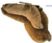
Lobo común Sudamericano