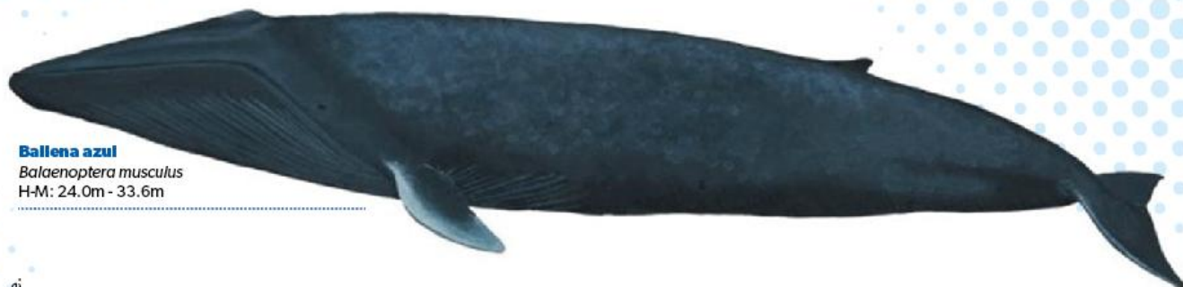
Ballena azul Balaenoptera musculus H-M: 24.0m - 33.6m